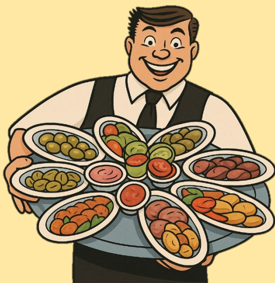
Summer platter with various LIPP specialties